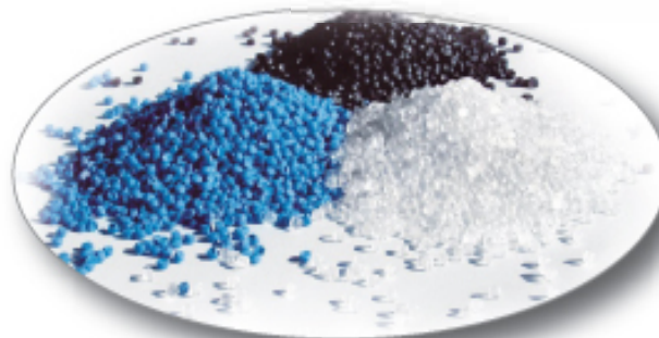
Materie prime – granuli in PVC