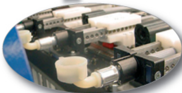
Sistemi automatici per montare i raccordi dei tubi