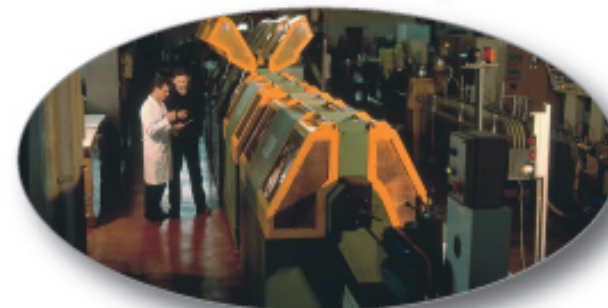
Linee di produzione e macchinari vengono disegnati e prodotti internamente